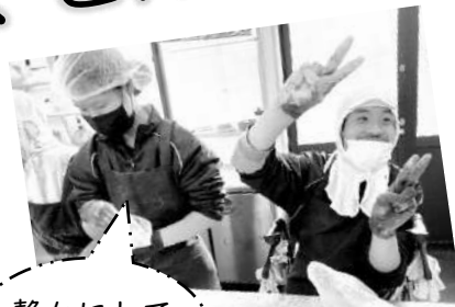
静かにして ください

今年もいろんな行事が控えてい ます。みんなで思いっきり、元 気に楽しみたいと思います☆