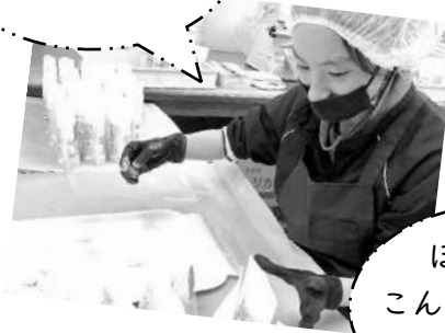
ほらほら～ こんなに売れ残っ てるんだよ～