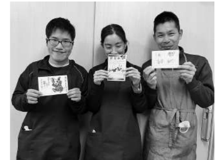
年賀状づくりに参加されたご利用者

事業所からご利用者へ出す「年賀状」。今回の年賀状づくりには、三名のご利用者が参加され、十一月頃から少しずつ準備を進め取り組んできました。例年冬のボーナスづくりの製造作業と重なる為、バタバタと過ごす中で作業となりましたが、年の瀬の十二月二十六日には無事に完成し、ご利用者皆さんへ投函することができました。参加されたご利用者の皆さん、お疲れ様でした！