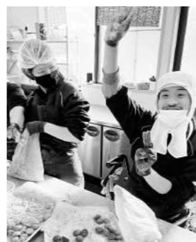
ボーナスづくり作業の様子

この冬もご利用者の「冬のボ ナスづくり」に取り組みました。 今回の販売では、「イロほろりの セット販売」を中心に、昨年 を上回る注文数となりました。 食品製造班では、十二月中頃ま で作業に追われる毎日となりま したが、皆で声を掛け合いなが ら元気に取り組めました。ご利 用いただいた皆様、本当に有難 うございました。 「イロほろり」の販売期間は秋 から春に掛けての間ですが、近 隣の直販店や道の駅等で随時販 売しております。ちよつとし た手土産やコーヒータイトムに ぜひご利用ください。