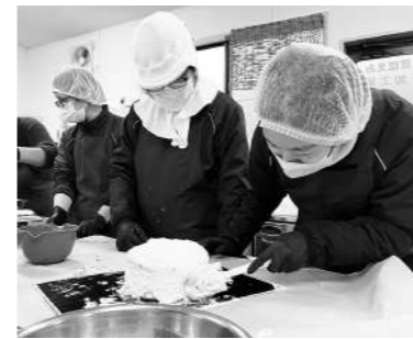
クリスマスケーキづくりの様子

去る十二月二十四日(土)恒例となっている冬の行事「クリスマスケーキづくり」を行いました。今回は最多となる十八名のご利用者が参加。三班に分かれて思い思いにデコレーションをしていき個性溢れる(?)美味しそうなケーキが無事に出上がりました。生クリームを絞ったりするなどのデコレーションを初めてされたご利用者からは「難しすぎるけど、楽しかった」と感想をいただきました。