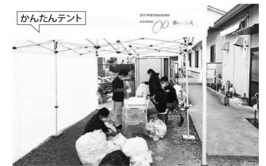
「かんたんテント」を使用した屋外での作業