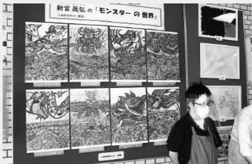
販売会に合わせて絵画の展示も行いました。