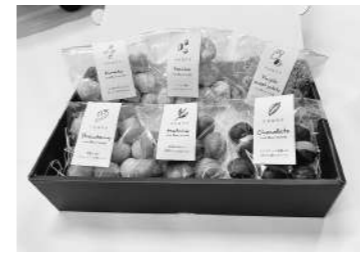
新商品の「イロほろり6種セット」

この冬もご利用者の「冬のボーナスづくり」に取り組みます。今回は新商品である米粉を使った焼き菓子「イロほろり」のセット販売を中心に、昨年冬の販売で好評を得た「おからほっぺクリスマスのチョコカップ」などをご用意。また、あやべ福祉会様からの商品もご用意しています。ちよつとした手土産やギフトにご利用ください。(詳しくは、別紙カタログチラシをご覧ください)