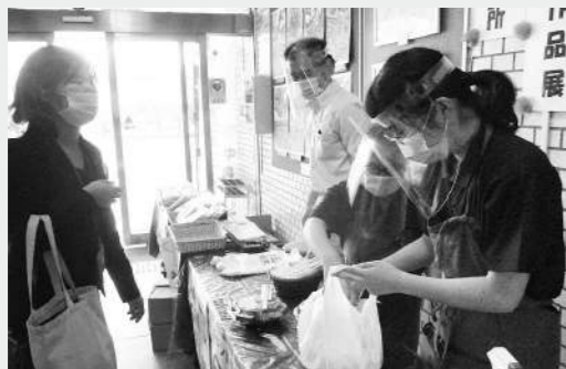
お昼時もあって弁当類は勢い良く販売。

去る九月七日（火）中丹西保健所で開かれた「はあつこはあつこに販売会」に出店しました。コロナ禍により昨年度より販売活動はほとんど行っていませんでしたが、久しぶりの出店ともあって、ご利用者の参加希望者も多数ありました。残念ながら売り子の人数制限がある為、ご利用者の中からは三名のみ参加となりましたが、当日は販売開始時から勢いよく売れ、お弁当類や新商品の「イロほろり」は完売することが出来ました。次回は十月二十四日（水）、福知山市役所で開かれる販売会に出店予定です。皆様のお越しをお待ちしています！