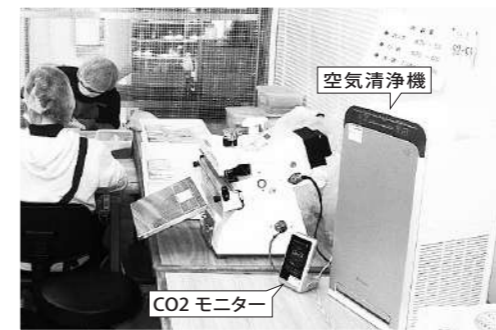
作業場に設置した CO2 モニターと空気清浄機

公益財団法人 JKA 様の 2021 年度公益事業振興補助事業として「新型コロナウイルス感染症の拡大防止策に対する支援」の公募があり申請を行いました。この事業は、施設に「新型コロナウイルス感染症の拡大防止のために必要な物資を整備」することが目的であり、当事業所からは、空気のスปีド除菌ができる「空気清浄機 (4 台)」、室内換気のタイミングが目で分かる「CO2モニター (4 台)」、密になりやすい作業を屋外で行うための「かんたんテント (1 張)」の導入を要望したところ、九月初めに交付決定通知(補助金額約 80 万円)が届き、購入させて頂きました。収束が見えないコロナ禍の中、またこれからのインフルエンザ等も含めた感染の予防に大いに活用させて頂きます。本当にありがとうございました。