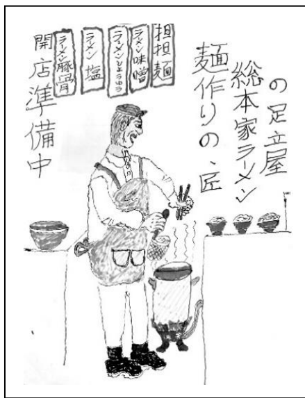
イラスト／足立 弘一さん